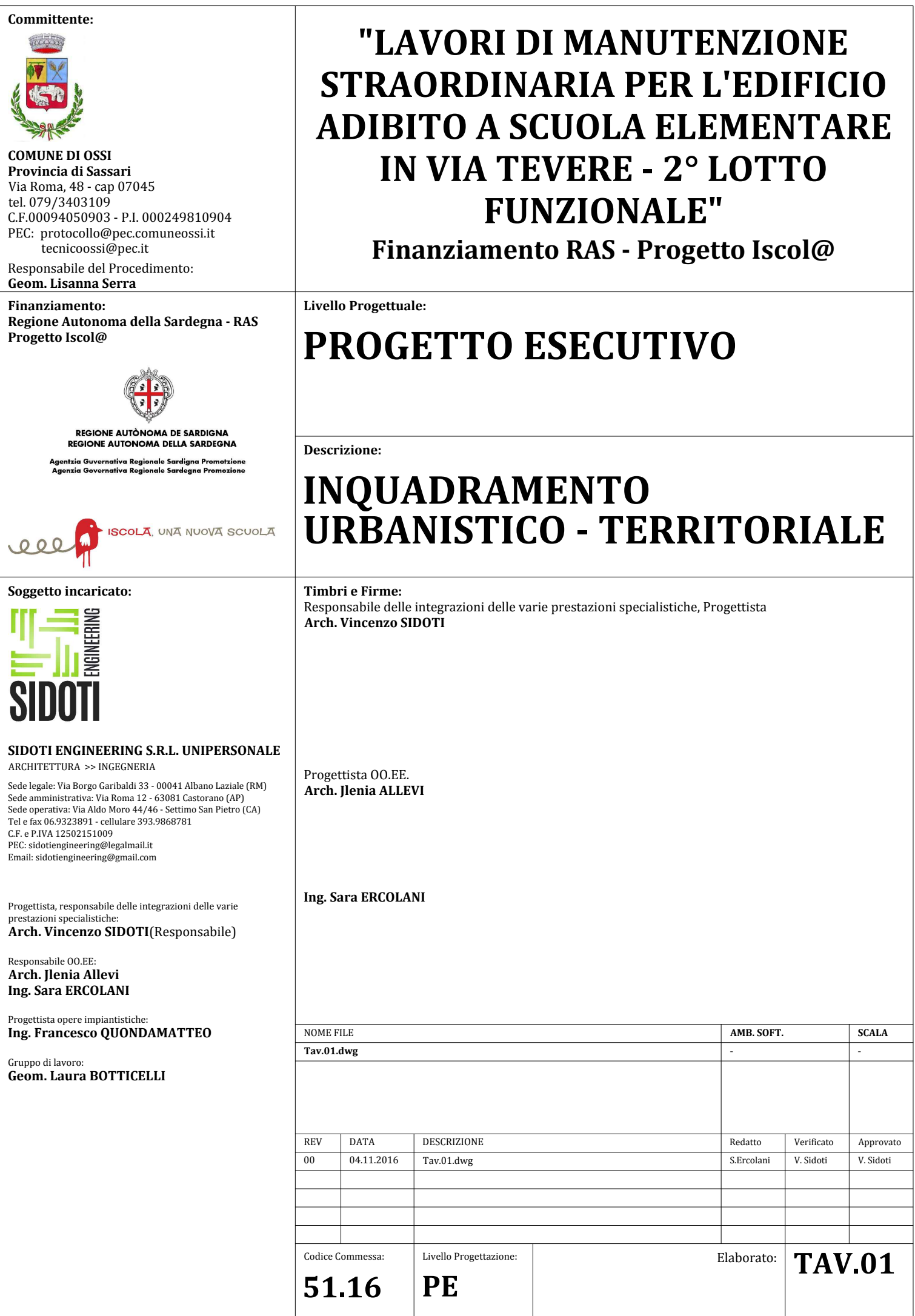
CTR - Scala 1:5000